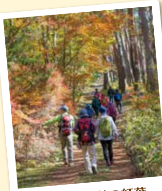
八ヶ岳山麓の紅葉