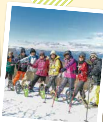
スノーシュートレッキング